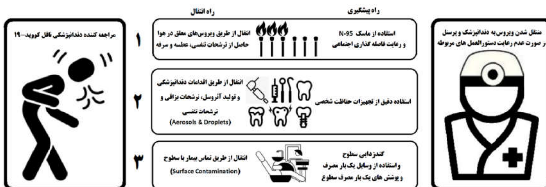
شکل ۱: راه‌های انتقال و راه‌های پیشگیری از انتقال کروناویروس به صورت کلی در محیط مراکز دندانپزشکی و حرفه‌وابسته.

دراپلت (Droplet) و آئروسول) و غیرمستقیم (تماس با سطوح) می‌تواند به راحتی در محیط مراکز دندانپزشکی و حرفه‌وابسته پراکنده شده و سبب ایجاد بیماری گردد. ۳۴ از این رو رعایت یک‌سری دستورالعمل‌های بهداشت شغلی و کنترل عفونت جهت کاهش پراکندگی ویروس در محیط‌های درمانی، به‌ویژه مطب‌ها و کلینیک‌های دندانپزشکی الزامی می‌باشد. در مبحث یافته‌های این مقاله سعی شده است با گردآوری مطالب متنوع از مقالات، دستورالعمل‌ها و گایدلاین‌های مرتبط با ارائه خدمات دندانپزشکی و حرفه‌وابسته، که مورد توافق اکثر مراجع علمی مورد اعتماد دندانپزشکی هستند، مجموعه‌ای مبتنی بر شواهد در هشت بخش حاوی اطلاعات علمی و بالینی کاربردی در اختیار جامعه دندانپزشکی کشور و حرفه‌وابسته، قرار داده شود.